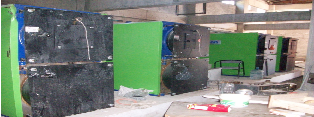
Sağlık Kampüsü Isı Merkezi-Şehir Yerleşkesi

Bu proje kapsamında 5.000.000,00-TL'si harcanarak; Sağlık Kampüsünde Isı merkezi binası, 168m galeri, 150m çevre himaye çiti, 150m yağmur suyu hattı, 6.660m 2 prefabrik beton parke otopark ve yol kaplaması, 50m kanalizasyon hattı, 1 adet 1.600 kVA trafo, 550 kVA jeneratör, 3 adet 900 kVA UPS, 2.500m besleme hattı, 2.400m enerji hattı, 5 adet monoblok prefabrik köşk, 1 adet jeneratör kabini, 1 adet 1400 kVAr kompanzasyon, 97m 2 taş duvar, 50m perde duvar, 4 adet 1.000.000 kcal/h kapasiteli kalorifer kazanı, 1 adet 40 ton yakıt tankı, 336m ısıtma hattı, 168m temiz su hattı; Taşlıçiftlik kampusünde 2.281m 2 yemekhane çevre düzenlemesi karosiman kaplama, 3.309m yemekhane önü asfalt kaplamalı yol ve otopark, 1.840m Ziraat Fakültesi uygulama alanları himaye çitleri yapılması, Yemekhane binası için 312m ısıtma hattı, 156m temiz su hattı, 156m sac tava imalatı ve galeri aydınlatması, 156m internet hattı, 156m zayıf akım ve 156m kuvvetli akım besleme hattı, kapalı spor salonu için 732m ısıtma hattı, 366m temiz su hattı, 366m sac tava imalatı ve galeri aydınlatması, 366m internet hattı, 366m zayıf akım ve 366m kuvvetli akım besleme hattı yapılmıştır.