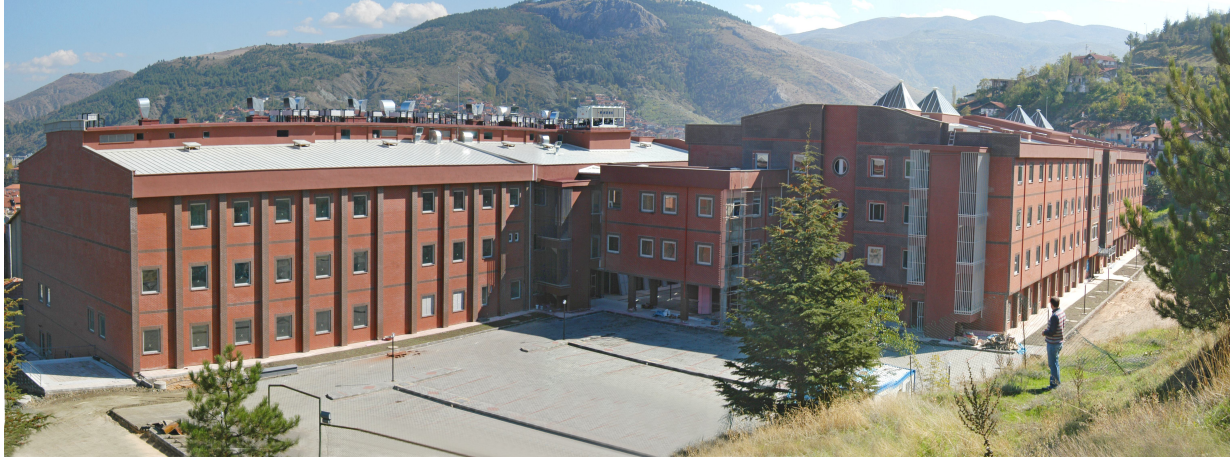
Üniversite Hastanesi İnşaatı

2008 yılında Hastane İnşaatı Projesi için 9.750.000,00-TL'si ödenek tahsis edilmiştir. Yıl içinde 1.900.000,00-TL'si ek ödenek daha tahsis edilmiştir. Bu proje kapsamında 11.262.448,00-TL'si harcanarak asma tavan, boya, granit, fayans, giydirme cephe, dış cephe kaplama, paslanmaz çelik su deposu, lavabo, wc taşı, eşanjör dairesi, aydınlatma imalat ve montajları tamamlanarak Hastane Binası İnşaatı bitirilmiştir.