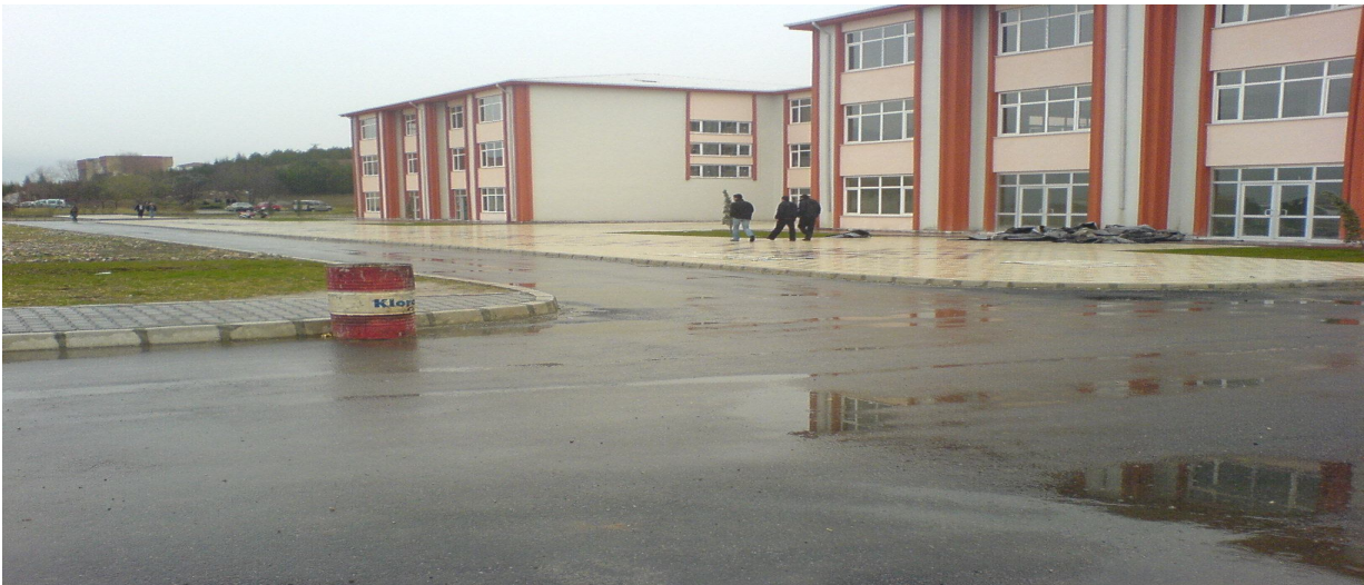
Yemekhane Binası Çevre Düzenlemesi