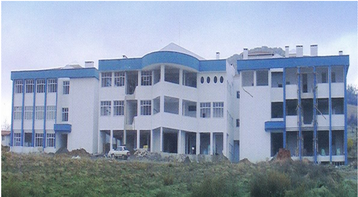
Zile Dinçerler Turizm İşletmeciliği ve Otelcilik Yüksekokulu İnşaatı

Ayrıca, şartlı bağış ve yardımlar ile 2007 yılında yapımına başlanan Üniversitemiz Zile Dinçerler Turizm İşletmeciliği ve Otelcilik Yüksekokulu inşaatı işine 2008 yılında Dinçerler ailesi tarafından 800.000,00-TL’sı bağış yapılmış olup, yıl içinde yatırım programı ile ilişkilendirilerek gelir-gider kayıtları yapılmak suretiyle 800.000,00-TL’sı kullanılmıştır.