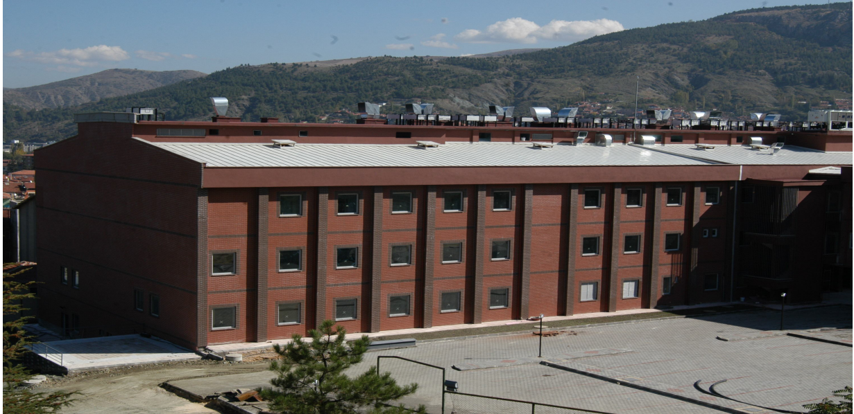
Üniversite Hastanesi İnşaatı