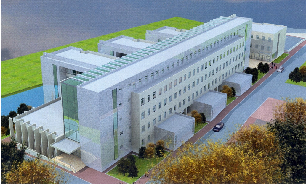
Tıp Fakültesi Morfoloji Binası

Çeşitli Ünitelerin Etüd Projesi işi için, 2008 Yılı Yatırım Programı ile 500.000,00-TL'sı ödenek tahsis edilmiştir. Bu proje kapsamında 337.539,00-TL'sı harcanarak 16.000 m 2 Tıp Fakültesi Morfoloji Binası Projesi ile 7.500 m 2 Eğitim Fakültesi Binası projesi çizdirilmiştir.