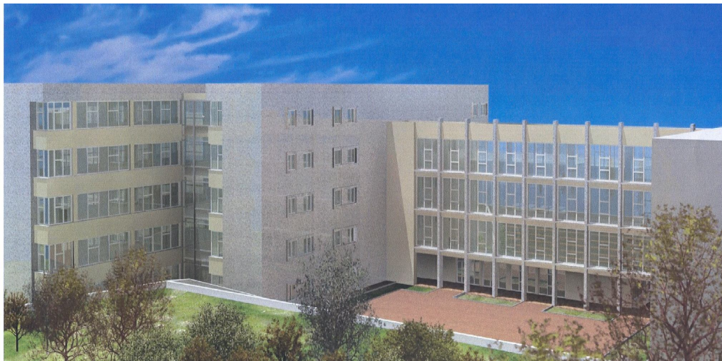
Eğitim Fakültesi Binası