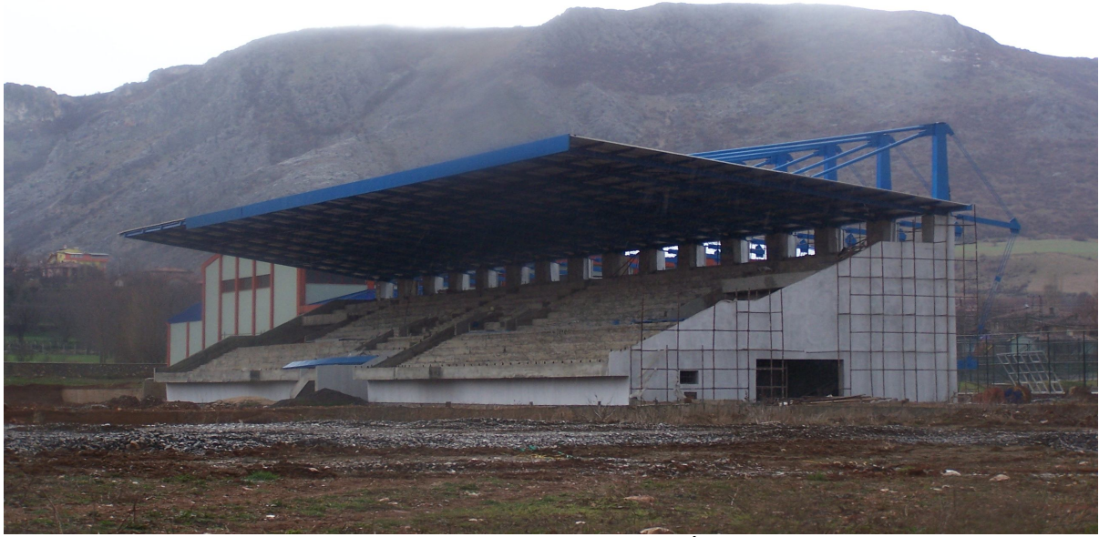
Futbol Sahası ve Tribün İnşaatı

2008 yılında Açık ve Kapalı Spor Tesisleri Projesi için 3.000.000,00-TL'si ödenek tahsis edilmiştir. Yıl içinde Futbol Sahası ve Tribün Binası kalan işleri ile açık hava spor alanları yapımı işi ihalesi yapılmış ve sözleşmeye bağlanarak işe başlanmıştır. Bu proje kapsamında 2008 yılı içinde 1.842.181,00-TL'si harcanmış olup; Tribün Binası izolasyon ve dış sıva imalatları, çelik çatı imalatı, Futbol Sahası drenaj imalatları ve açık hava spor alanlarının zemin kaplamaları tamamlanmıştır.