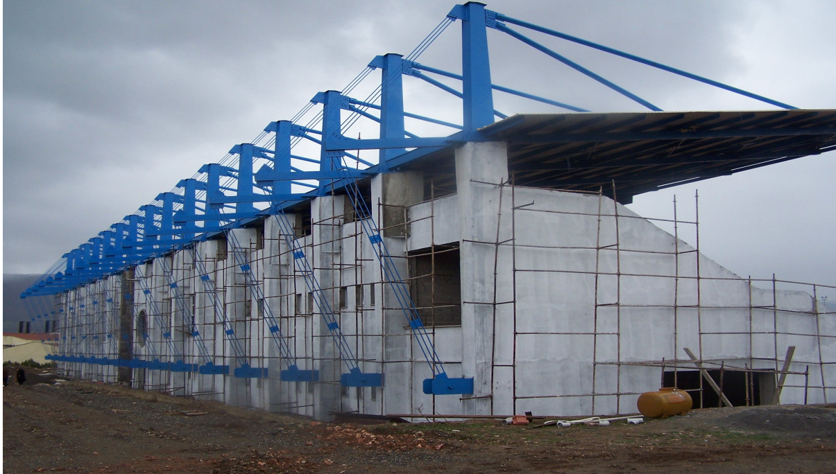
Futbol Sahası ve Tribün İnşaatı