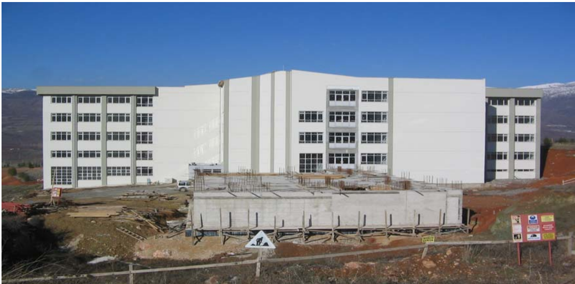
Eğitim Fakültesi Dekanlık Binası

5.2. Eğitim Fakültesi Binası inşaatı için 2.150.000,00 TL harcanmış olup mevcut bina inşaatı %95 oranında tamamlanmış, Dekanlık binası betonarme işlerinin %20'si tamamlanmıştır.