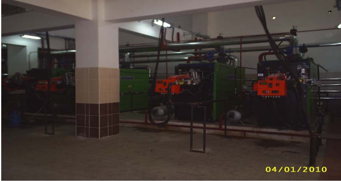
Sağlık Kampüsü Isı Merkezi

4- Kampüs Altyapı İkmal İnşaatı işine 3.010.000,00 TL harcanarak; Taşçıiftlik kampüsü ısı merkezi doğalgaz dönüşüm işleri, 2 adet kızgın su kazanı imalatı, Sağlık kampüsü ısı merkezi doğalgaz işleri, Eğitim Fakültesi binası galeri betonarme işleri yapılmıştır.