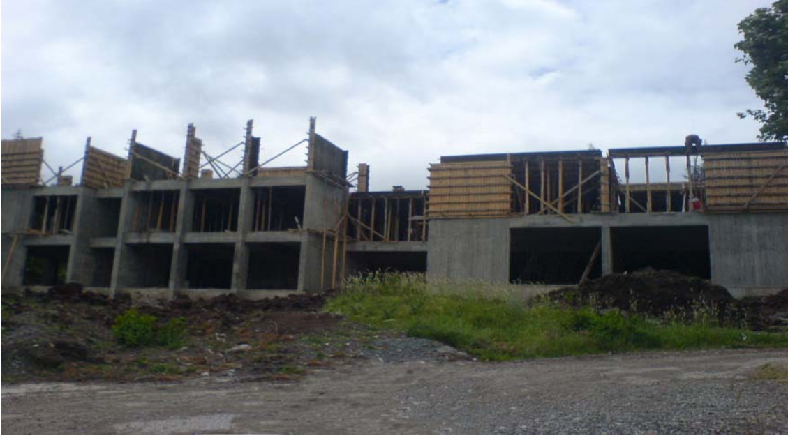
Almus Meslek Yüksek Okulu

5.3. Almus Meslek Yüksekokulu Binası inşaatı için 599.938,00TL harcanmış olup, Temel betonarme işleri, betonarme karkas inşaatının %50'si, temel topraklama imalatları tamamlanmıştır.