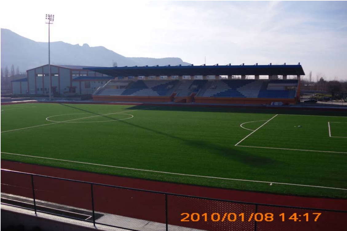
Futbol Sahası ve Tribün Binası