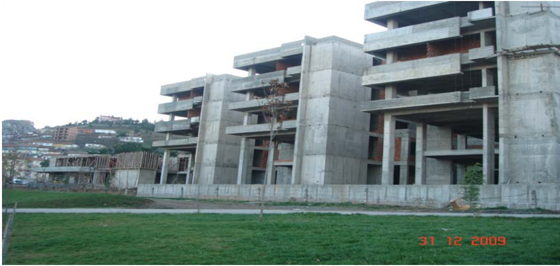
Tıp Fakültesi Morfoloji Binası

5.1. Tıp Fakültesi Morfoloji Binası inşaatı için 3.750.000,00 TL harcanmış olup, betonarme karkas inşaatı %85 oranında, iç tuğla duvar imalatları %50 oranında tamamlanmıştır.