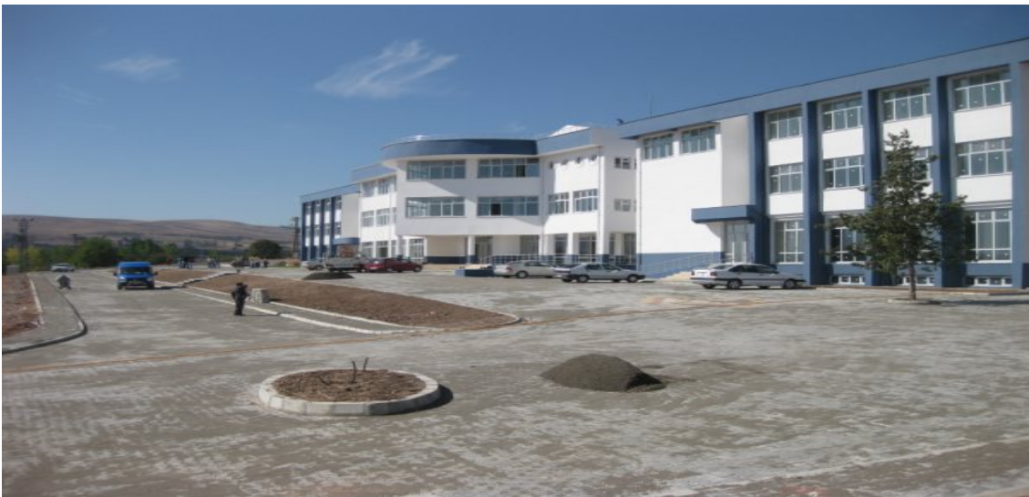
Zile Dinçerler Turizm ve İşletmecilik Yüksekokulu

6- Hayırsever Dinçerler ailesi tarafından yaptırılan Zile Dinçerler Turizm İşletmeciliği ve Otelcilik Yüksekokulu binası inşaatı bitirilmiş olup eğitim ve öğretime açılmıştır.