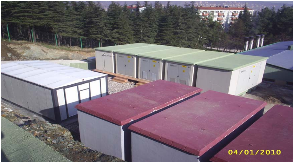
Sağlık Kampüsü Orta Gerilim ve Alçak Gerilim Sistemleri